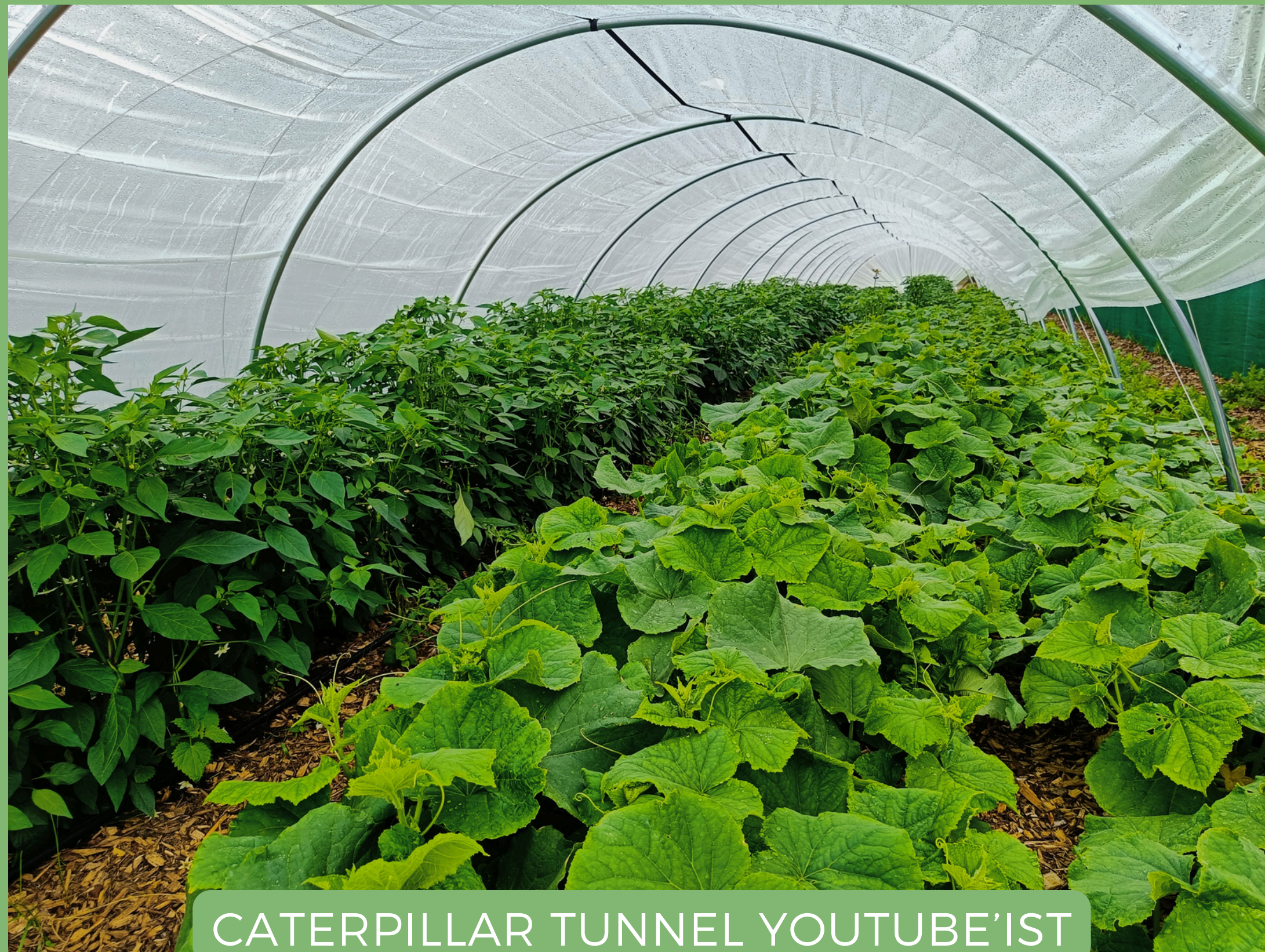
CATERPILLAR TUNNEL YOUTUBE'IST