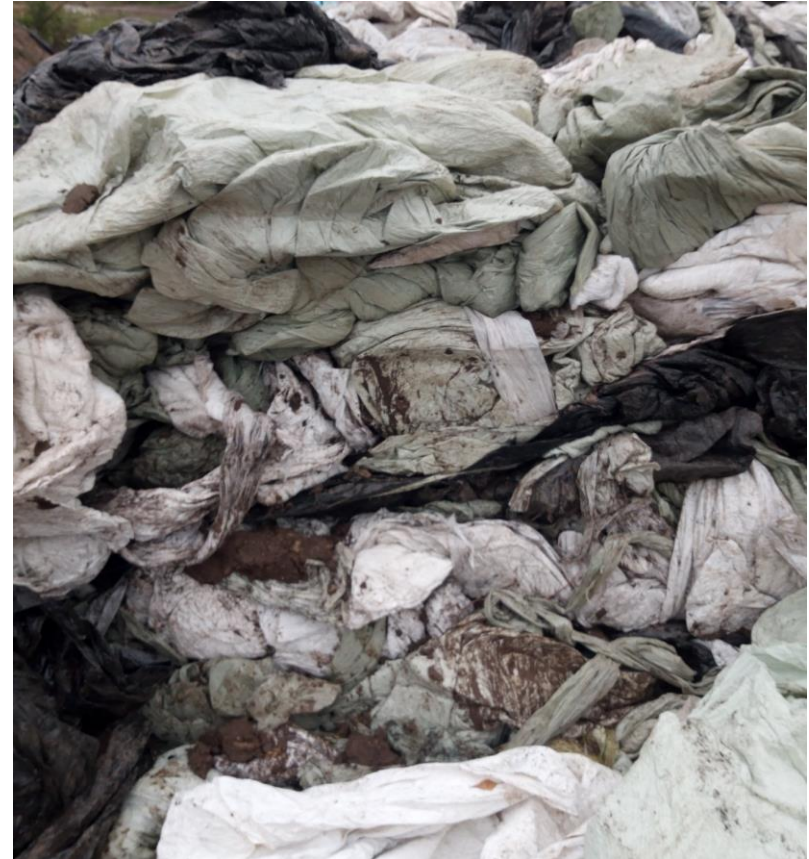
Materjal on omavahel sõlmes ja kile vahel on suured pinnase tükid.