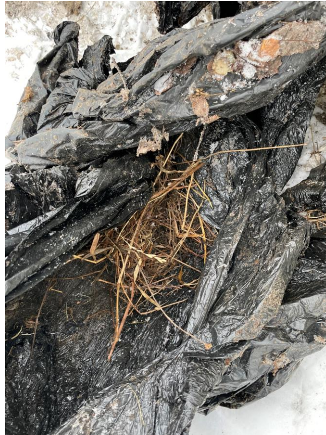
Taimede / silo jäägid.