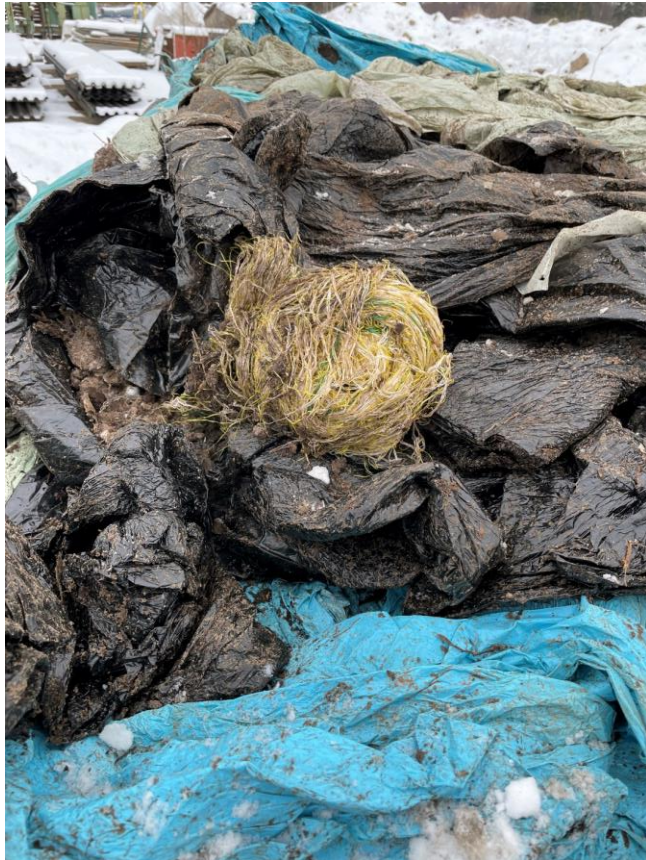
Võrk segamini kilega, suured pinnase tükid.