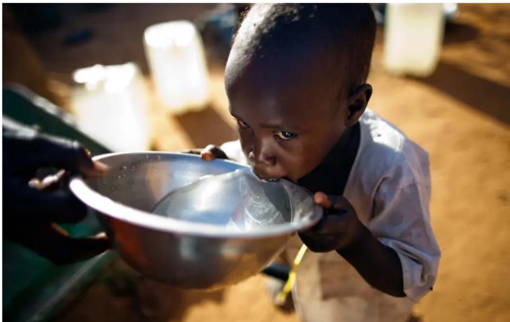
Hinnanguliselt pole 70 protsendil Sahara-taguse Aafrika elanikkonnast võimalust ammutada ohutut joogivett.

Ühinenud Rahvaste Organisatsioon (ÜRO) hoiatab värskes raportis kogu maailma ees terendava veekriisi eest. Ühtlasi peab olema inimkond valmis ületarbimisest tingitud veenappuseks ja seda võimendavaks kliimamuutuseks.