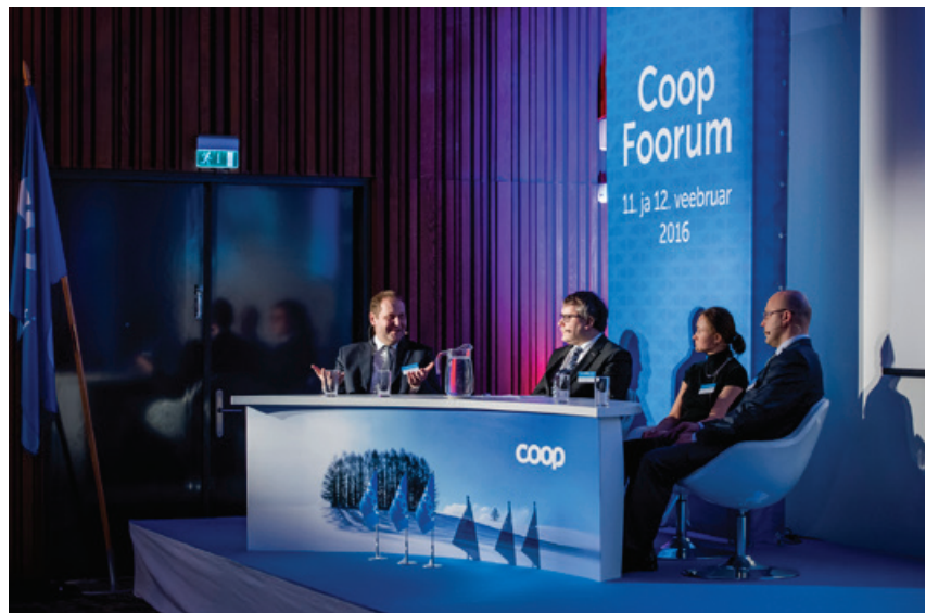
Ebaausad kauplemistavad olid arutluse all 11. veebruaril Tartus toimunud Coop Foorumil