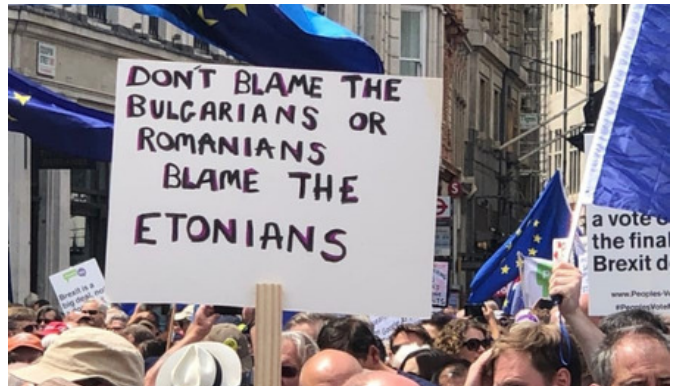
Hetk Brexiti pooldajate meeleavalduselt