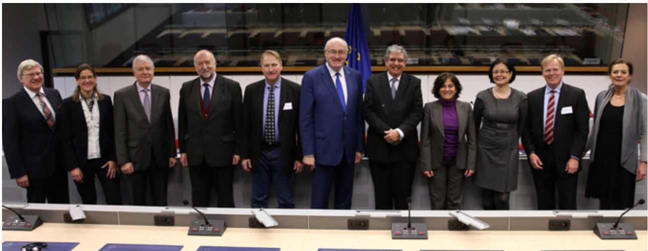
Põllumajandusturgude kõrgetasemeline ekspertgrupp koos põllumajandusvolinik Phil Hoganiga.

Loe pikemalt: http://www.eesc.europa.eu/?i=portal.en.nat-opinions.37923