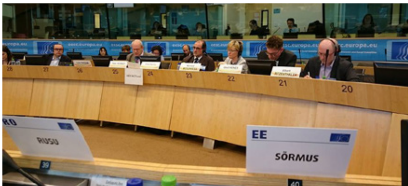
Ebaausate kaubandustavade arutelul Euroopa Majandus- ja Sotsiaalkomitees osales Europarlamendi asepresident Mairead McGuinness

7. juunil vastu võetud resolutsioonis kutsuvad saadikud Euroopa Komisjoni üles esitama ettepanekud, kuidas tõhustada võitlust ebaõiglaste kaubandustavadega toiduainete tarneahelas. Eesmärgiks on tagada õiglane tasu põllumeestele ja laiem valik tarbijatele ning õiglased ja läbipaistvad suhted toidutootjate, -tarnijate ja -turustajate vahel, et vältida ületootmist ja toidu raiskamist.