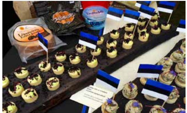
Eesti toit Vilniuses: Eesti juust küüslaugukreemi ja tuhase kadakakrõbedikuga ning suitsuräim krõbedal saial jänese kapsa geeliga.