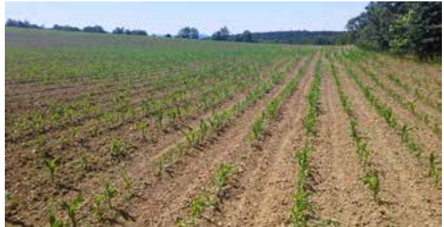
Austria mahemaisi põllud annavad hektarilt 8-10 tonni tera. Umbrohutõrjeks kasutatakse ka käsitööd.