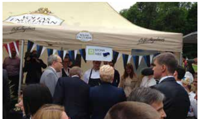
Leedu president Dalia Grybauskaitė uudistab Eesti toitu