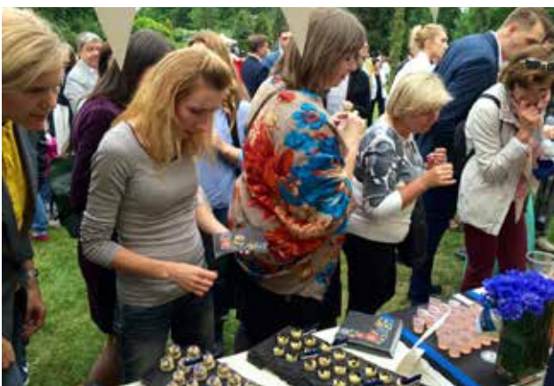
Eesti toidu vastu tunti Vilniuse jaanipäeva festivalil suurt huvi