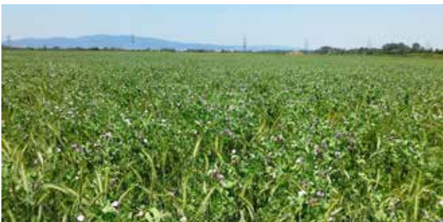
Bernhard Schindleri talus kasvav vikk ja tritikale jõuavad ettevõttes peetavate mahesigade toidulauale.