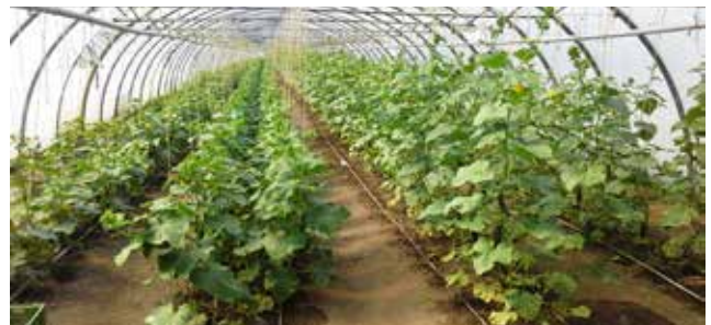
Viini lähedal asuv Adamah mahetalu turustab oma toodangu peamiselt mahekastide kaudu otse tarbijale. 120 ha talu aastane müügitulu koos kõigi tegevusharudega ulatub 10 miljoni euroni.