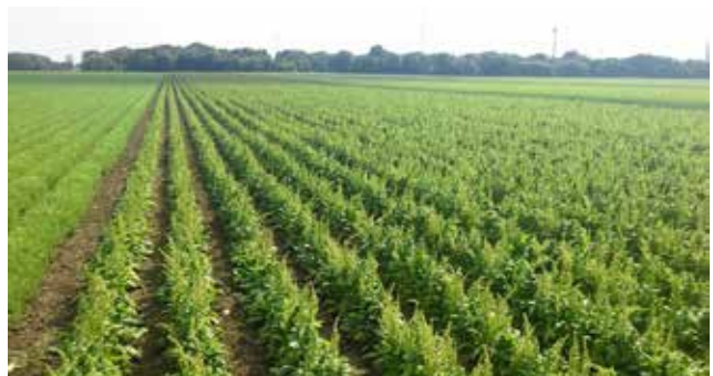
Gerhard Hofile kuuluvas talus kasvatatakse teiste kultuuride hulgas ka läätsed ja spinatit. Austria mahepõldudelt umbrohtu naljalt ei leia.