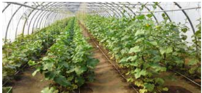
Viini lähedal asuv Adamah mahetalu turustab oma toodangu peamiselt mahekastide kaudu otse tarbijale. 120 ha talu aastane müügitulu koos kõigi tegevusharudega ulatub 10 miljoni euroni.