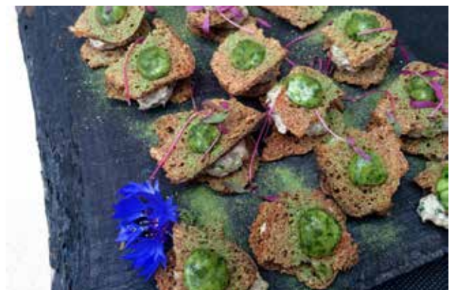
Eesti toit Vilniuses: soolapõder kodusel leivakrõbuskil nõgesemajoneesiga